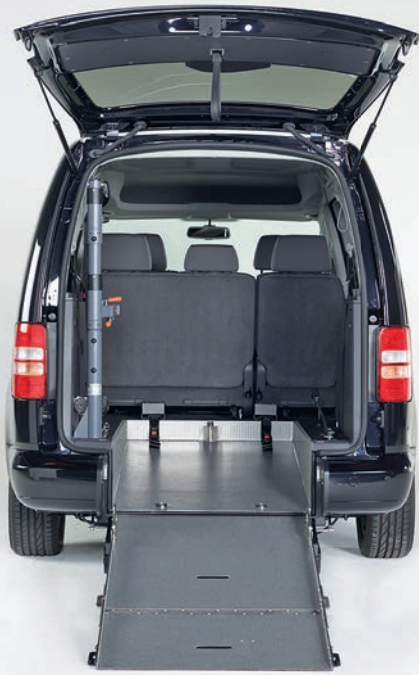
Heckeinsteige für Kinder & Erwachsene. Sitzend oder liegend.