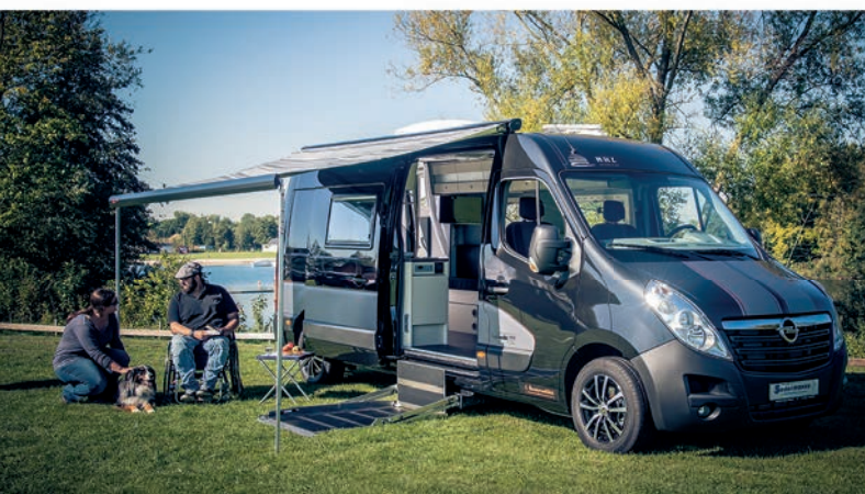
Reisemobile komplett mit Küche, Dusche & WC. Alles barrierefrei.