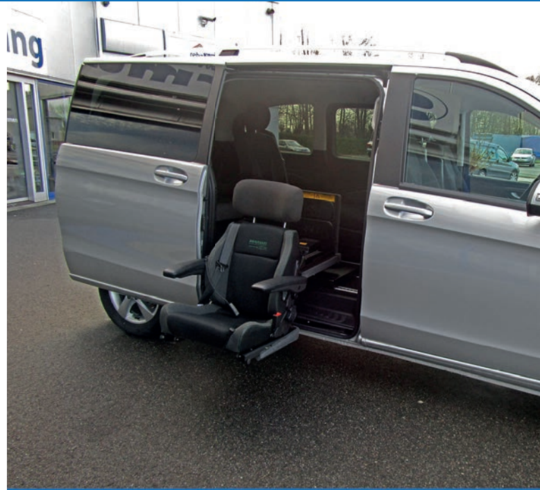
Schwenksitze erleichtern das Ein- & Aussteigen. Einfach und bequem.