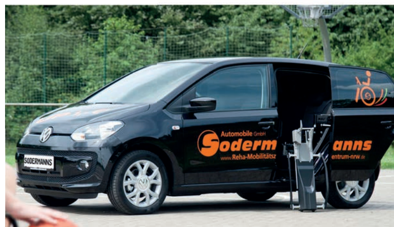
Kompakte und schicke Kleinwagen für drei Personen und mit vollem Kofferraumvolumen.