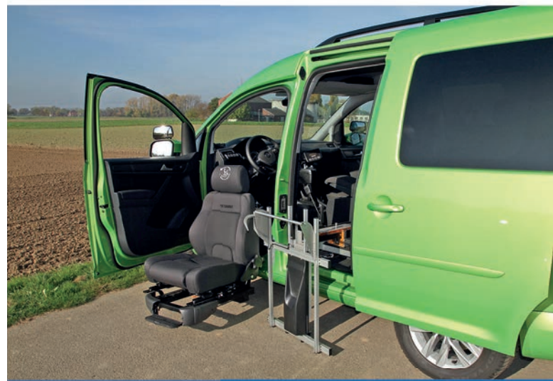
Selbstfahrerumbauten mit mechanischen o. elektronisch-digitalen Gas-Brems & Lenksystemen und Rollstuhlverladevorrichtungen.