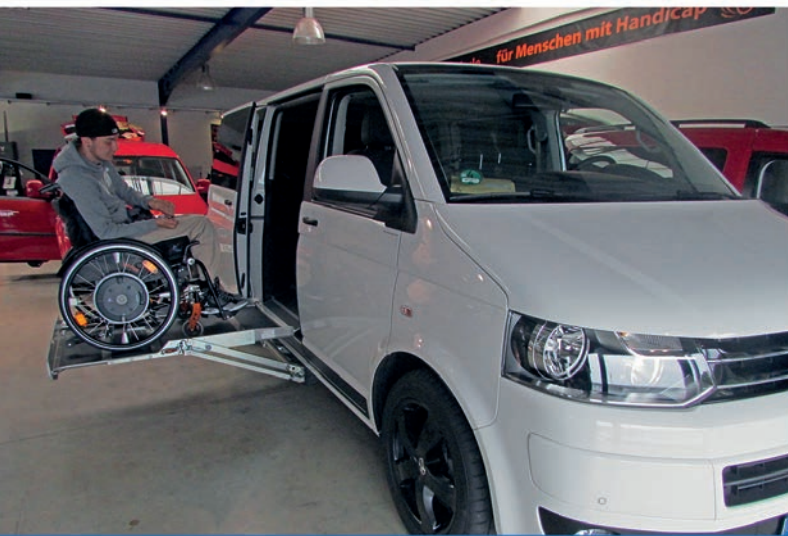
Vans für Selbstfahrer oder Beifahrer mit Liftsystemen.